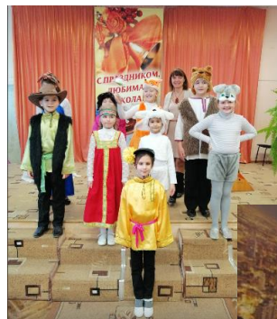
Школьный Хобби-центр «Одуванчик»

Инклюзивные смены в детском оздоровительном лагере при школе «Муравейник»