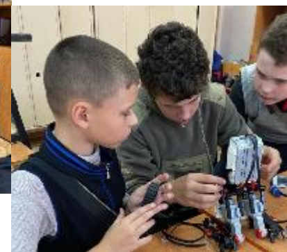
Инклюзивные смены в детском оздоровительном лагере при школе «Муравейник»