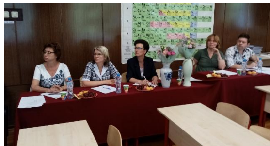
Работа в составе экспертной комиссии