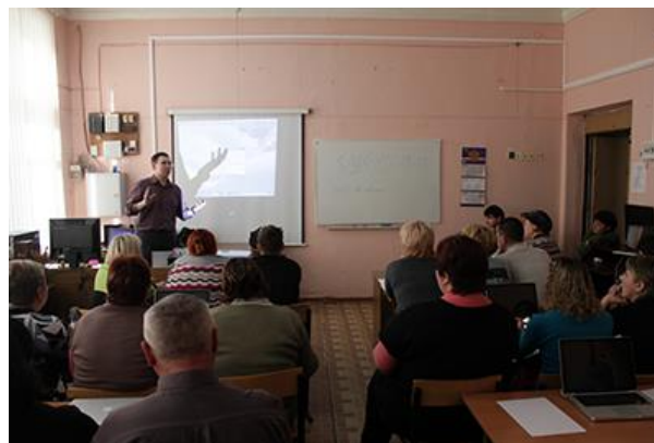
Предоставление услуг психологической, социальной и помощи: «Лаборатория родительских отношений»