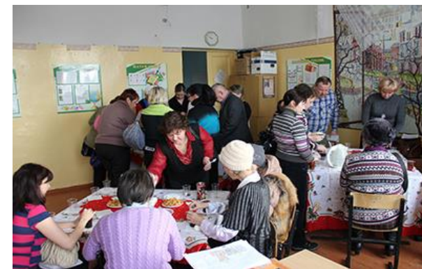
Работа Управляющего совета МБОУ СОШ № 12