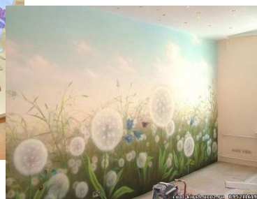
Школьный проект «Воспитание детей с ОВЗ и инвалидностью средствами искусства»