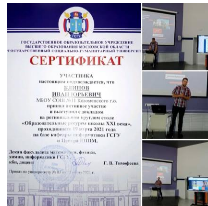
Региональный круглый стол «Образовательные ресурсы школы XXI века»