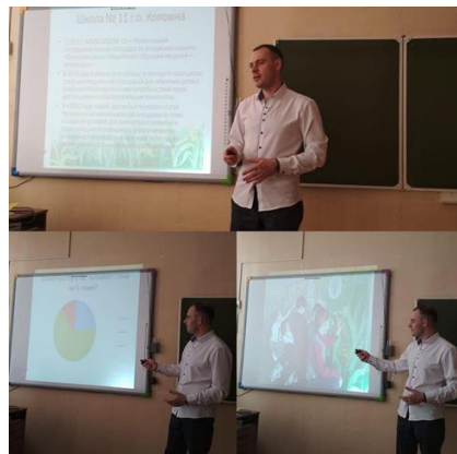
Региональный мастер-класс "Духовно-нравственное воспитание и образования в условиях цифровой образовательной среды"