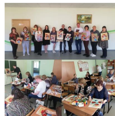
Муниципальная творческая лаборатория для учителей ИЗО