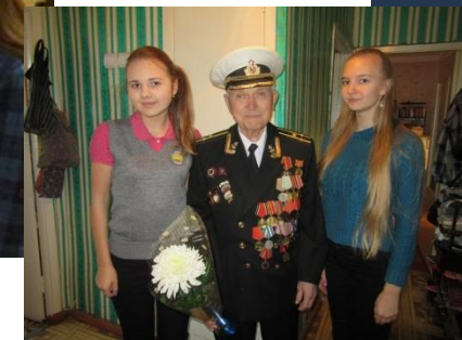
Волонтерские отряды школьного волонтерского объединения «Лучи добра!»