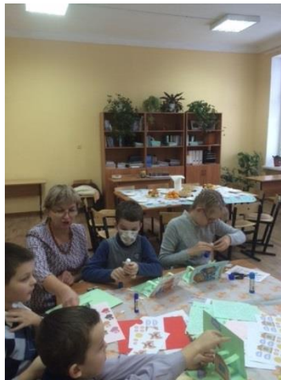
Заседание школьного детско-родительского клуба «Мы вместе»

Школьное детско-родительское волонтерское движение