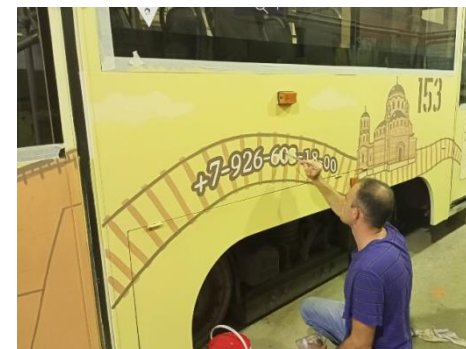
Участие в реализации городского проекта «Коломенский трамвай желаний»