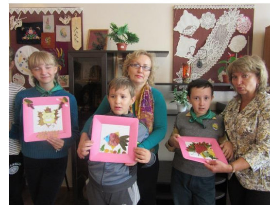
Школьное детско-родительское волонтерское движение